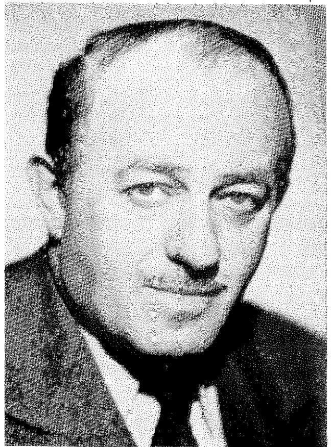
בן הכט, מן הדמויות הבולטות בעולם התיאטרון האמריקני, נימנה עם האישים שהעניקו ל"אנסוור" חומר ויוקרה